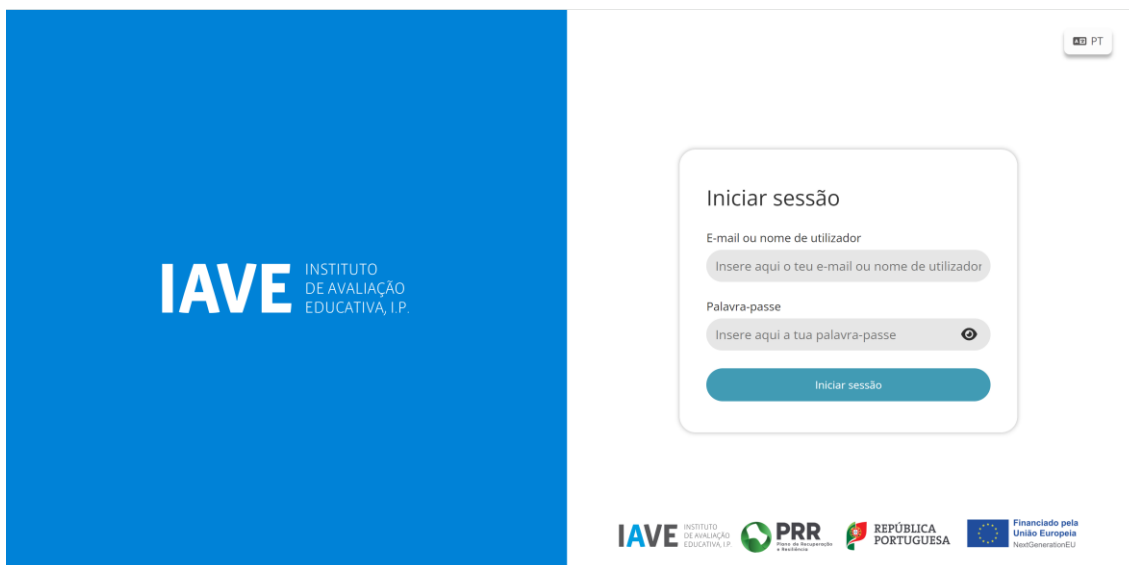
Figura 1 – Acesso à Plataforma de Realização de Provas do IAVE

c) Inserir as credenciais “Nome de utilizador” e “Palavra-passe” e, em seguida, clicar em “Aceder” ou “Iniciar sessão”.